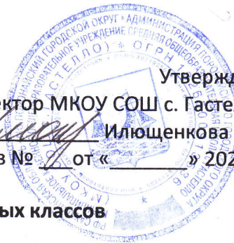
График итогового контроля обучающихся начальных классов за III четверть 2021-2022 учебного года