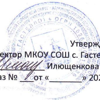
График итогового контроля обучающихся 9 класса за III четверть 2021-2022 учебного года