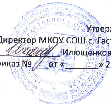
График проведения контрольных работ обучающихся 9 класса за II четверть 2021-2022 учебного года