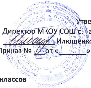
График проведения контрольных работ обучающихся 10, 11 классов за I полугодие 2021-2022 учебного года