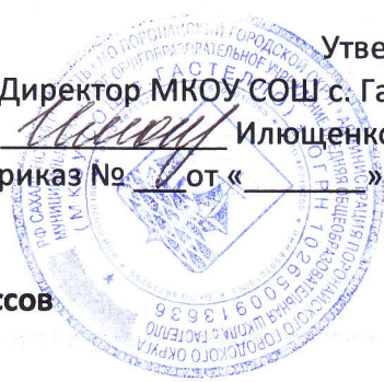
График проведения контрольных работ обучающихся 5-8 классов за II четверть 2021-2022 учебного года