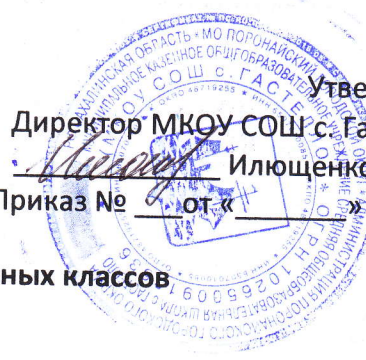
График проведения контрольных работ обучающихся начальных классов за II четверть 2021-2022 учебного года